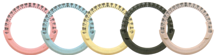
ピンク ブルー イエロー ※グレー ※ベージュ