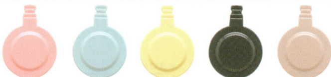
ピンク ブルー イエロー グレー ベージュ

※視力検査の際に使用するテストフレームです。(一般のユーザー様への販売対応はしていません。ご了承下さい。)