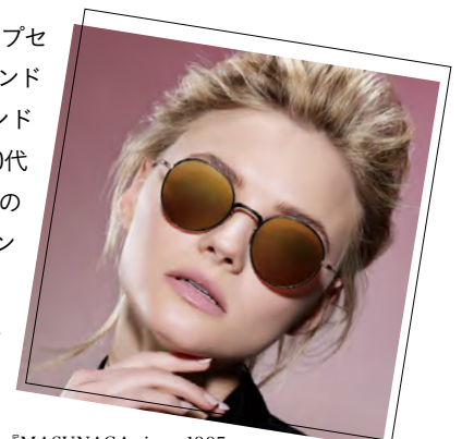
『MASUNAGA since 1905』 WRIGHT SG ¥43,000(税抜)